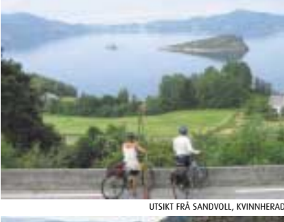
UTSIKT FRÅ SANDVOLL, KVINNHERAD